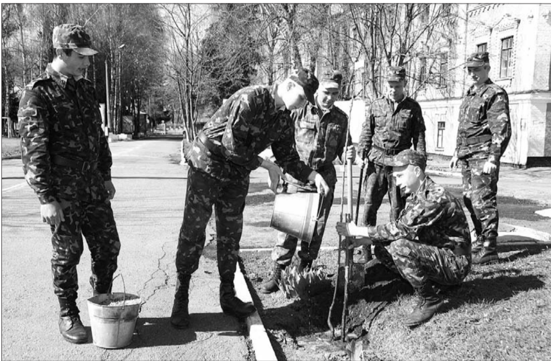
Є у полку така добра традиція, коли демобілізовані солдати садять молоді дерева на згадку про свою службу в частині. У переддень “дсмбля” традицію підтримали і кримські хлопці...